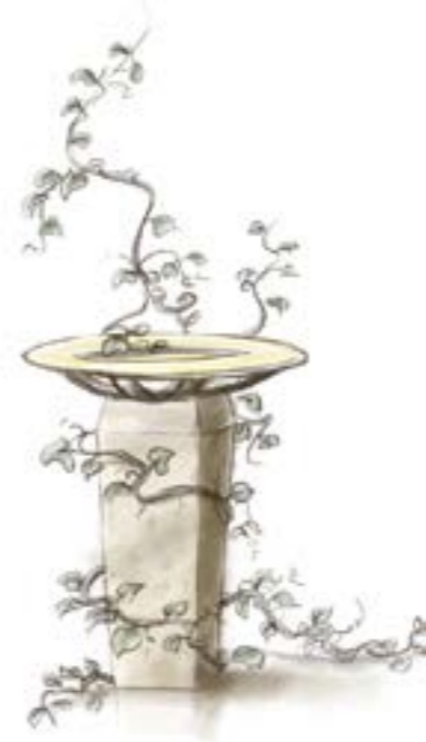
Grafik: © Tim Löhndorf

Persönliche Informationen wie Amtshandlungen werden nur in der gedruckten Ausgabe veröffentlicht.