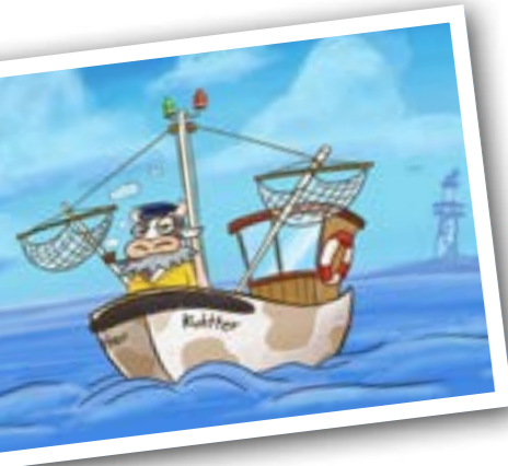
▲ Der Kuchtter: Damit gehen die Kühe an der Küste auf Kuhgelfischjagd.