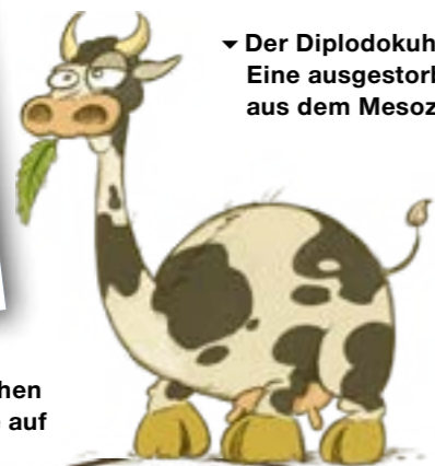
▼ Der Diplodokuh: Eine ausgestorbene Kuhart aus dem Mesozoikum