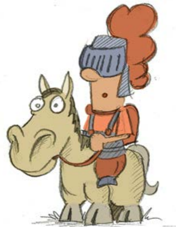
Illustrationen: © 2016 Tim Löhndorf

Am 4. Advent werden die Pfadfinder das Licht aus Bethlehem in unsere Kirche tragen. Bitte bringen Sie eine vor Wind und Regen geschützte Kerze mit. Nehmen Sie das Licht gerne mit nach Hause und geben es weiter. So tun es Menschen auf der ganzen Welt und setzen ein Zeichen des Friedens.