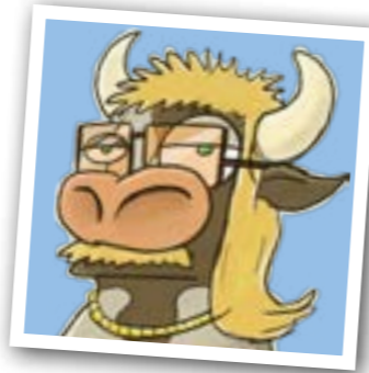
▶ Der Vokuhila: Eine Frisur, die in der Kuhwelt nie aus der Mode kommt.