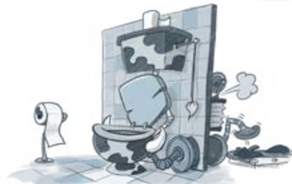
▲ Der Lokuh: ein Ort, wo die Kuh von Welt sich erleichtern kann.

Jeden Mittwoch ein neues Kuhnstwerk auf artbuexxe.de/kuh